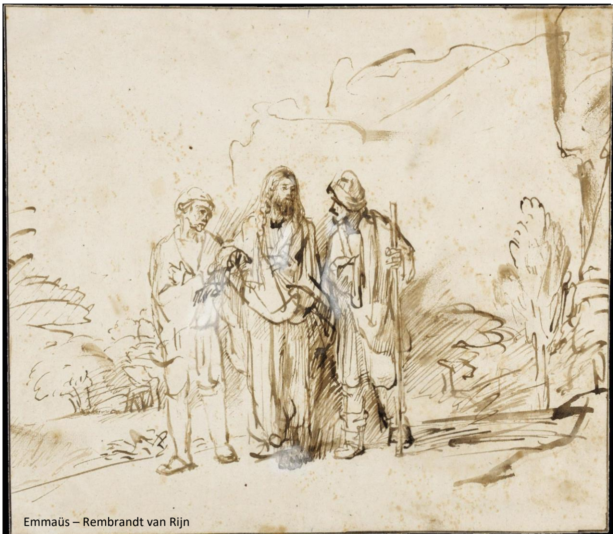
Emmaüs – Rembrandt van Rijn

Deze drievoudige roeping wordt in een prachtig Engelstalig zinnetje uitgedrukt: To love Him more dearly, to know him more clearly, to follow Him more nearly (Hem inniger liefhebben, Hem helderder kennen, Hem naderbij volgen).