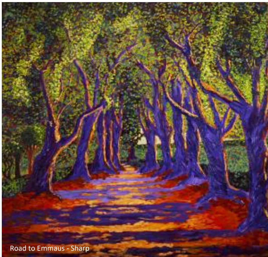
Road to Emmaus - Sharp

De gelovigen die zich geroepen weten zich in te zetten voor de opbouw en voortgang van de parochie en de geloofsgemeenschappen kunnen rekenen op ondersteuning en de mogelijkheid hun talenten te ontwikkelen door scholing, vorming en toerusting. Waar mogelijk zal dit 'on the job' gebeuren en zien de pastores dit ook als een onderdeel van hun taak. De aangewezen weg kan ook zijn het volgen van een cursus of training. Zo mogelijk kan de toerusting in groepsverband in de parochie worden georganiseerd. In andere gevallen wordt een individueel traject gezocht.